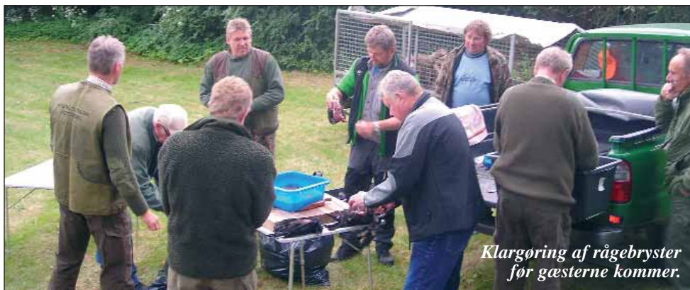
Klargøring af rågebryster for gæsterne kommer.