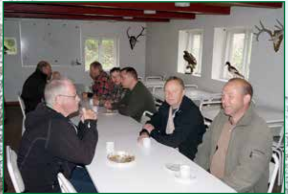
Også lidt til os som ikke fik buk d. 16. maj 2013