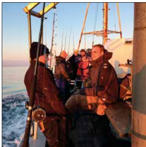
På vej mod nye fiske steder

Vi sejlede som vanligt ca 1,5 time ned langs kysten forbi Lønstrup og Rubjerg Knude. Skipper fandt nogle steder og fiskeriet startede. De første steder var der dog ikke mange fisk, men der blev hevet et par stykke op.