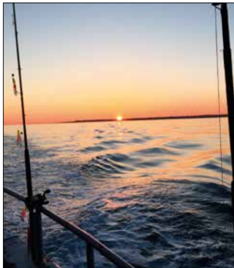
Smuk solopgang over Hirtshals

Dagen for årets fisketur indfandt sig. Ugen optil havde det blæst rigtig meget, men som magi stilnede vejer af fredag og lørdag morgen viste sig som en af de smukkeste. I forsøget på ikke at være den sidste ankomne mødte jeg op kl 5:00 (en time før afgang) for kun at finde, at de fleste var mødt op allerede. Dette resulterede i, af vi kunne komme af sted en halv time før planlagt afgang.