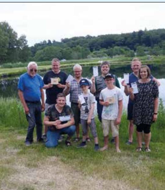
Her et billede af de stolte vindere.